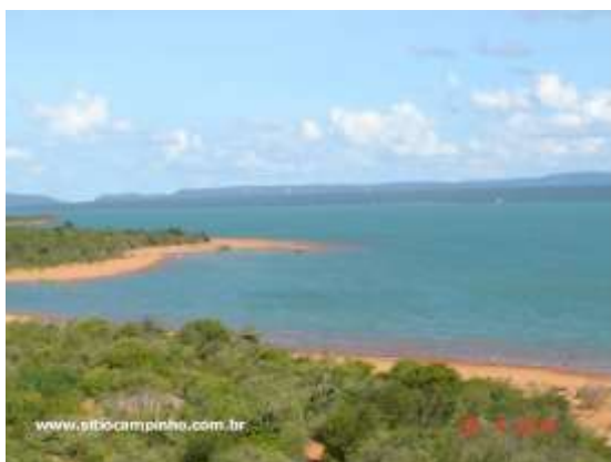
Figura 12 - Praia do Sobrado – Icó Mandantes