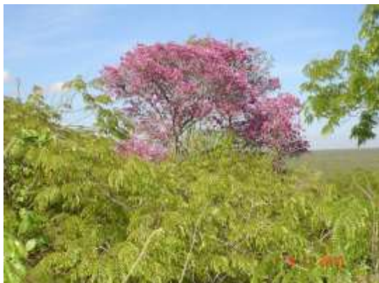
Figura 10 - Ipê Roxo – Reserva Legal do Icó Mandantes

também, com o incremento do ecoturismo e este por sua vez para o desenvolvimento da agroecologia sustentável tão necessária para a região de Itaparica e do mundo.