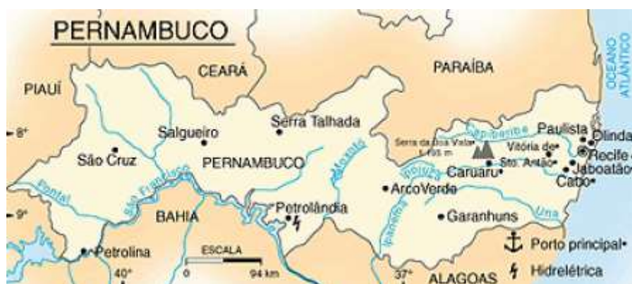
Figura 04 Localização de Petrolândia no mapa de Pernambuco

Petrolândia está localizada às margens do Lago de Itaparica e a 430 km do Recife. Com uma população de 36.000 habitantes tem o quarto maior PIB per capita de Pernambuco segundo dados do IBGE 2009: 16.513,18. Fica atrás apenas de Ipojuca 93.791,75, Itapissuma 22.900,72 e Cabo de Santo Agostinho 22.301,09. Tudo isso graças a Construção da Barragem de Itaparica.