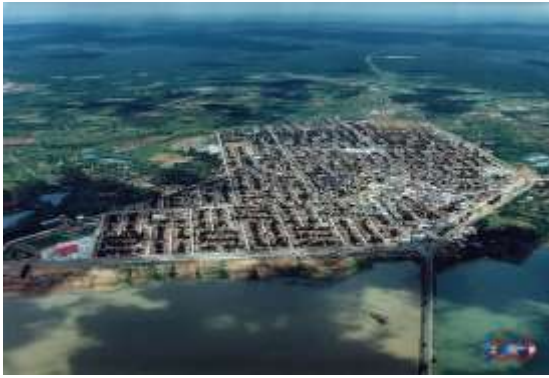
Figura 05 Vista aérea da Cidade de Petrolândia