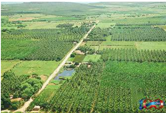
Figura 08 Cultura coco no Projeto Apolônio Sales

O primeiro motor que faz girar a economia de Petrolândia é a Usina Hidrelétrica Luiz Gonzaga. O segundo é a agricultura familiar irrigada que produz alimentos hortifrutigranjeiros que são enviados diariamente para todas as regiões do País.