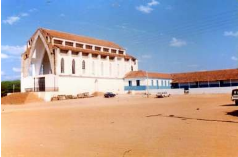
Figura 02 Igreja do sagrado Coração de Jesus, Barreira, Petrolândia, Pernambuco

A monumental igreja de então mesmo inacabada, localizada na parte alta do Projeto, contemplava toda área irrigada pelos colonos e também grande extensão do bioma da caatinga do semiárido nordestino em direção a Vázea Redonda, Mandantes e Limão Bravo, região esta conhecida há 150 anos como Deserto dos Campinhos. Mesmo assim se transformou, através da fé, no símbolo da esperança do sertanejo pobre que via através dela e do sucesso alcançado pela agricultura irrigada no Posto Agrícola do Rio São Francisco (Icó) e no Núcleo Colonial de Petrolândia a solução para os problemas enfrentados nas longas estiagens. Enfim, ela era e ainda é a esperança que o sertanejo mantém de um dia sair da pobreza absoluta.