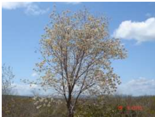
Figura 11 - Pau de Ema - Reserva Legal do Icó Mandantes