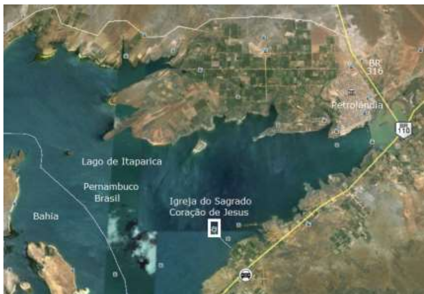
Figura 03 - Localização da Igreja do sagrado Coração de Jesus, Barreira, Petrolândia, Pernambuco no Google Earth.