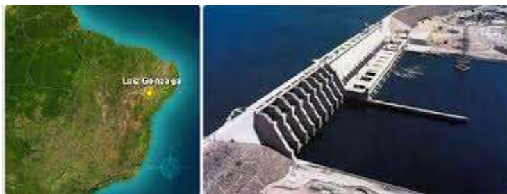
Figura 07 Usina Hidrelétrica Luiz Gonzaga (Barragem de Itaparica)

O primeiro motor que faz girar a economia de Petrolândia é a Usina Hidrelétrica Luiz Gonzaga. O segundo é a agricultura familiar irrigada que produz alimentos hortifrutigranjeiros que são enviados diariamente para todas as regiões do País.