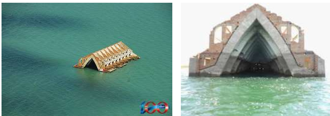
Figura 01 - Igreja do Sagrado Coração de Jesus, Lago de Itaparica, Petrolândia, Pernambuco.

Em 2013 Petrolândia completou 104 anos de emancipação e três centenários de história. Tudo começou quando, no século XVIII, colonizadores e missionários por aqui chegaram passando a viverem e conviverem com índios nativos às Margens do Rio São Francisco, especialmente os Pankararus. Com a construção da Barragem, do seu patrimônio histórico cultural arquitetônico, restaram apenas ruínas da Igreja do Sagrado Coração de Jesus. Localizada, hoje no meio Lago de Itaparica, resiste bravamente à ação destruidora implacável do tempo e das águas do Velho Chico. (Fig. 01)