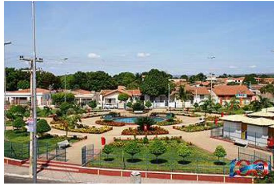
Figura 06 Praça dos três Poderes Petrolândia, Pernambuco.