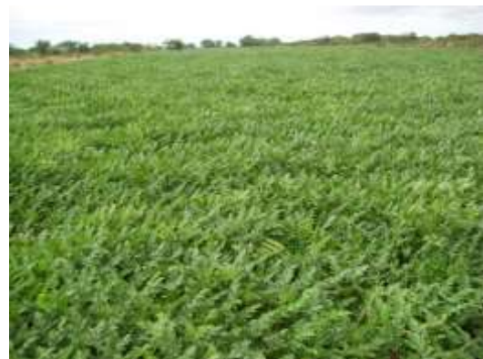
Figura 09 Cultura de Melancia-Projeto Icó Mandantes

O potencial de Petrolândia para o turismo é excelente, especialmente na modalidade ecoturismo. A sua fauna e flora, ainda inexplorada formada pelo lago, é rica e deslumbrante. A transformação da Igreja do Sagrado Coração de Jesus, localizada no lago, em Santuário Católico, trará importantes resultados para a preservação dos valores cristãos, além de contribuir, significativamente, para a geração de emprego e renda com o conseqüente crescimento do turismo. Contribuirá,