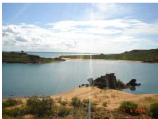
Figura 13 - Praia do Sobrado – Icó Mandantes